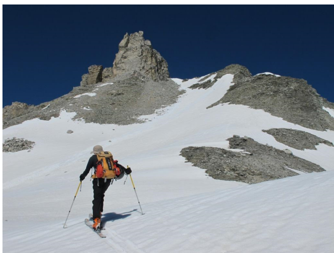
Ultimo tratto della salita verso la Gengiva

La Rognosa d'Etiache, una delle più belle montagne dell'alta Val di Susa, è nota per le spettacolari pareti di quarzite rosso bruna che la caratterizzano e la farebbero ritenere una meta inaccessibile con gli sci.