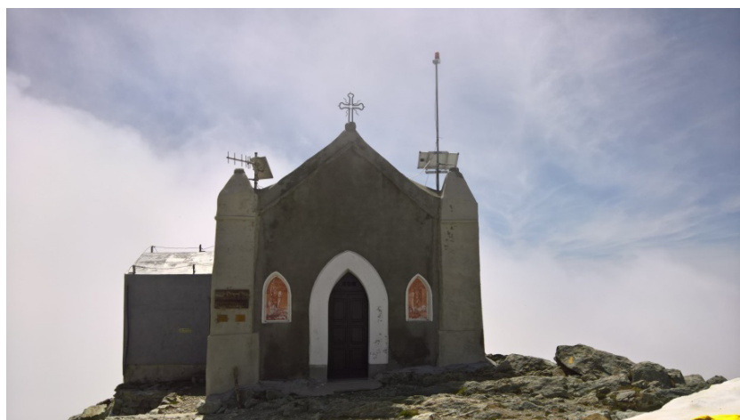
Cappella al Monte Robinet

Discesa dal percorso di salita, oppure dal Robinet traversando alla Punta Loson per poi scendere al Colletto Balma e da qui ai laghi e al Rifugio.