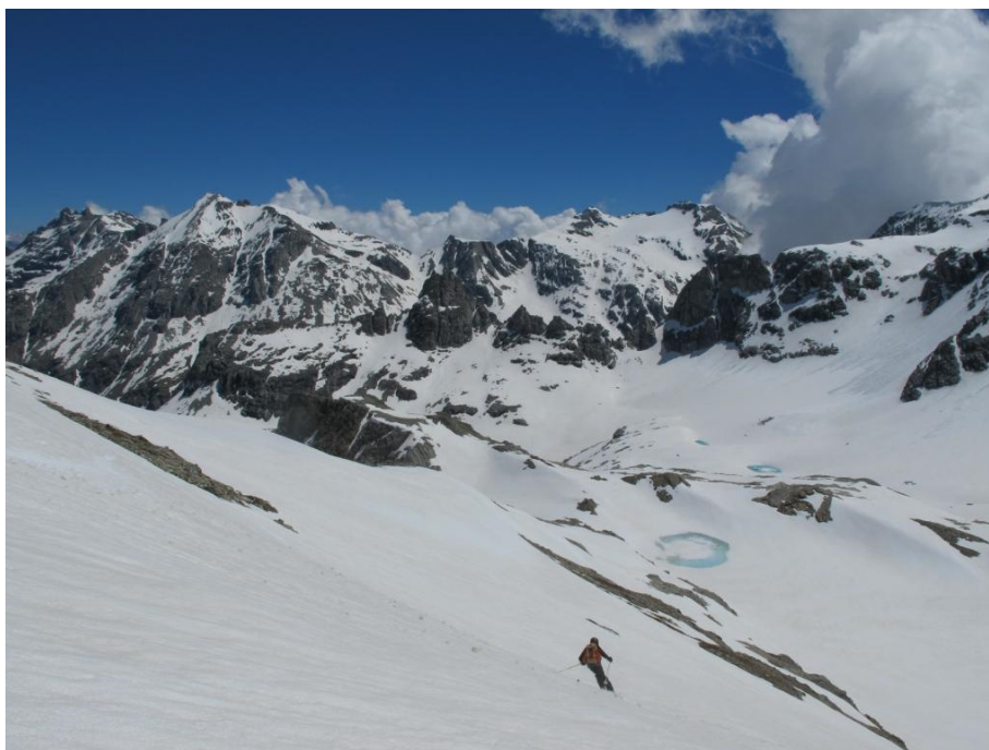
Discesa di fronte al gruppo dell'Ambin

La salita sulla cima del Punto Nodale richiederebbe un'arrampicata impegnativa, che non viene qui proposta. La discesa si svolge lungo l'itinerario di salita.